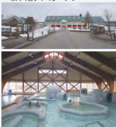
▲13種類のアトラクションがある温泉プール(水着着用)