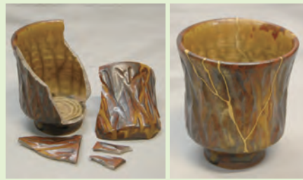
▲ポピュラーな茶碗の金継ぎ(左:修理前・右:修理後)

廃材に眠る価値を発見し、デザインや新技術によって、価値の高い商品を生み出す「アップサイクル」は、リサイクルの新しいスタイル。