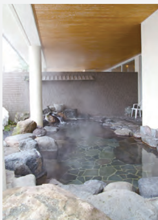
▲ゆったり入れる露天風呂

おしゃれな洋風の建物は、ホテルやレストラン、温泉を使った健康づくりのための運動プール、それに温泉入浴施設などからなっている。