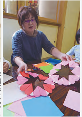
▶老若男女が楽しめる折紙づくりは、遊びの定番になっているようだ