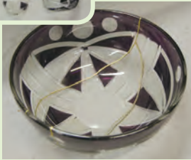
▲ガラスの器の金継ぎ(左上:修理前・右:修理後)