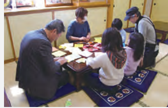
◀会場では、大人や子どもとオセロゲームや将棋なども楽しめる

「何人ぐらい利用されていますか。」 ○学校の行事などの関係で、開催日によって違いですが、15名ほどです。こちらとしては毎回30名ぐらいは対応できるように準備はしています。土曜は親が勤めているケースもあるので、大人の方は少ないですね。