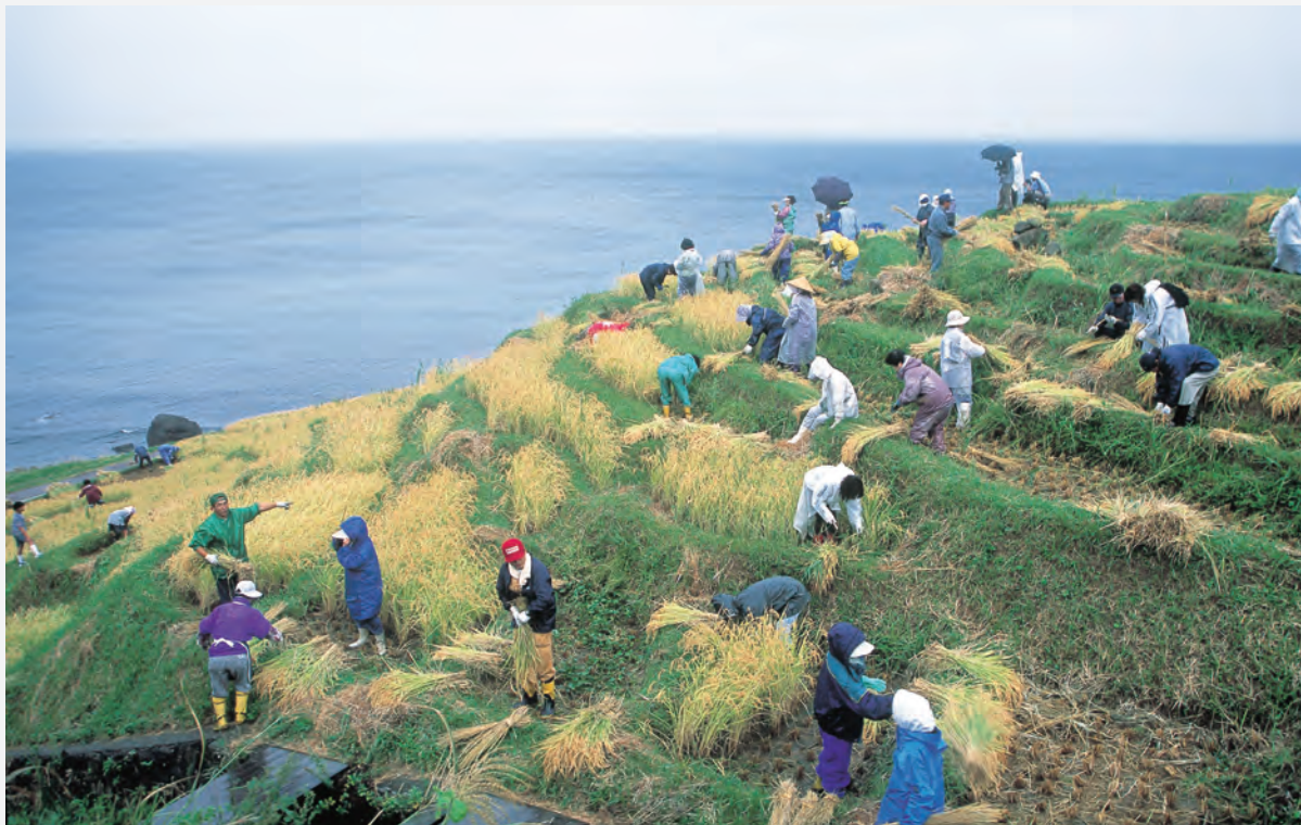
石川県輪島市の国指定文化財名勝「白米千枚田」での秋の収穫。