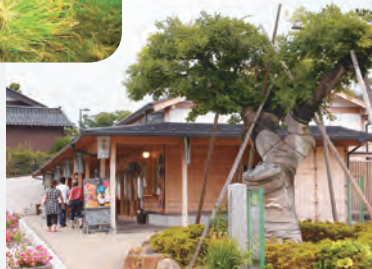
お土産品やレストランが入った道の駅は、千枚田の拠点施設

◀オーナー会員の制度は、年会費2万円でマイ田んぼを1枚につき3000円(追加は1人2枚まで)で持つことができ、耕作作業を年間7回(田起こし、あぜ塗り、田植え、草刈り3回、稲刈り)するもので、特典として収穫米を10kg+地元産の山菜などが進呈される。