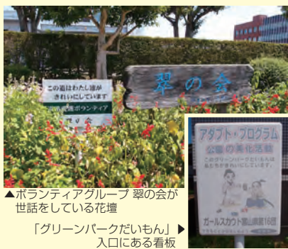
▲ボランティアグループ 翠の会が世話をしている花壇 「グリーンパークだいもん」入口にある看板

とりが今日の活動についての感想や反省などの意見を、みんなの前で発表することにして「それです。」 例えば、アダプト・プログラムで公園のゴミ拾いをした後は「今日はどんなゴミが多かった?」とが、「ゴミを拾ってどう思った?」といったことについて、他の団員の前で自分の意見として発表します。少女が自らの判断で行動し、それについて自分の考えを持ち、さらには人前で堂々と発表できる力をつけるためです。 このような取り組みが地域や保護者から高く評価され、第16団は今年の新入団者が9名にも達するなど、その活動が関係者から注目されています。