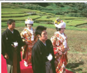
千枚田と道の駅を拠点に6次産業化を図り、地域活性化の起爆剤に。写真は千枚田での結婚式。