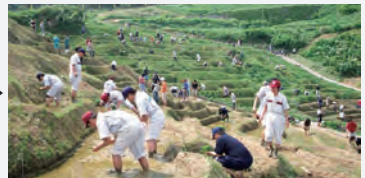
2011年に「能登の里山里海」が世界農業遺産に認定され、そのシンボルとして、また「日本の原風景」として、白米千枚田への関心が高まってきた。