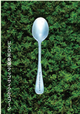
UXO(不発弾)アップサイクルスプーン

「不発弾をアップサイクルした金属とその他の廃材からできています」と、不発弾以外のアルミ廃材が混入していることを断っている。