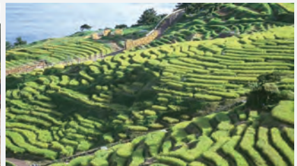
▲石川県輪島市の「白米千枚田」は総面積が約40051㎡、田の枚数は1004枚、田の平均面積18㎡。2001年に国指定文化財名勝。