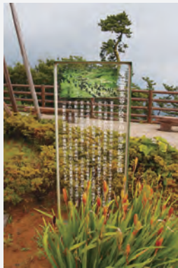
▲景観保全に先駆的な取り組みをした安城東高校の記念碑