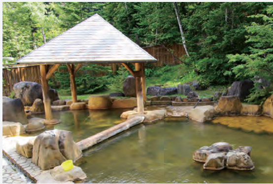
▲広い湯船に大量の源泉を投入(男性用)

下呂市小坂町の国道41号から濁河温泉までの距離は約37km。山肌を縫うように御嶽山の7合目、標高1800mの温泉地までゆるい上り坂が続いている。道路はよく整備され、緑の林間を進むので気持ちもいいが、なせ山道で40km近い距離を走るのは、スピードが出せないだけに長く感じる。数軒の宿が点在する濁河の温泉街は、全体が深い原