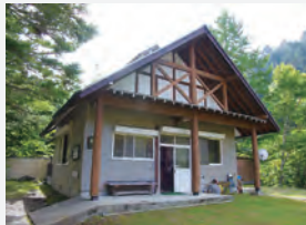
▲建物は森のなかの山小屋といった風情。

入浴料金/大人500円 営業期間/4月中旬～11月上旬 (期間中、原則無休) 営業時間/9:00～17:00 (※変更になることもある) 住所/岐阜県下呂市小坂町落合濁河 駐車場/あり 電話/0576-62-3373