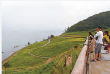
▲2013年にリニューアルした「道の駅千枚田ポケットパーク」には、千枚田の絶景を望む展望台が併設されている。