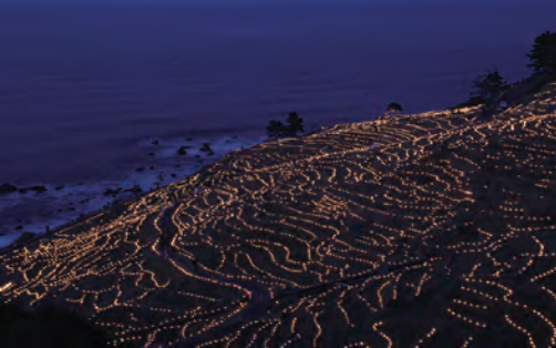
▲2008年の冬から「千枚田あぜの万燈(あかり)」が始まる。その後、ソーラーLEDによる2万個余りの明かりが夜の千枚田を幻想的に彩る「あぜのきらめき」へと発展。冬のイベントとして定着。