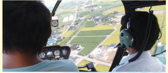
上…ヘリコプターの機内 下…アフロランドおやべーでの遊覧飛行 たくさん家族連れで賑わう。

○空を飛ぶ体験 だれでも飛行機は普通に乗っている。ところがヘリコプターとなると、乗る機会そのものが限られている。そんな中で4人乗り小型ヘリに乗ってみたところ、これは同じ空飛ぶ乗り物、飛行機とはまったく別物である。