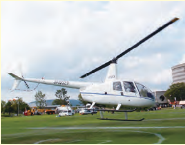
▲遊覧飛行に離陸するヘリコプター

○空を飛ぶ体験 だれでも飛行機は普通に乗っている。ところがヘリコプターとなると、乗る機会そのものが限られている。そんな中で4人乗り小型ヘリに乗ってみたところ、これは同じ空飛ぶ乗り物、飛行機とはまったく別物である。