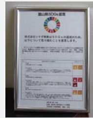
▲富山県SDGs宣言パネル