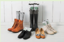
▲おしゃれなデザインの「炭草花」シリーズの「ブーツキーパー」

創業が1949年のアール・タチバナの「アール」は「環境」を造り出すことを意味し、グループ企業の「アイオティカーボン(株)」では、解体材や流木から製造した高温炭化木炭の脱臭と調湿機能を生かした様々な商品を開発。なかでも生活雑貨ブランド「炭草花(すみくさはな)」の「シューキーパー・セル」、 「ブーツキーパー」、「ハンガー」などは全国の専門店やネットで展開して注目を集めている。