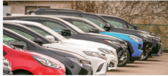
▲わが国の自動車の平均使用年数は、2006年に11.4年だったが、2019年には15.6年まで伸びている。

▼新車の販売数(2019年)は505万台、廃車の数が336万台、また中古車の輸出が162万台。写真は使い終わったクルマが整然と並び日本オートリサイクル(株)の立体式の廃車置場。