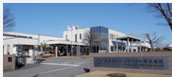
▲富山市エコタウン事業は、廃棄物をゼロにすることを旨とする「ゼロエミッション構想」を軸に、2002年に全国で16番目、北陸では初めて国から認可を受けた。現在、日本オートリサイクル(株)など7施設が操業。