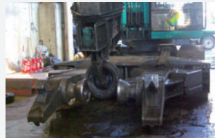
▶タイヤとホイールを一瞬に分離する「タイヤホイール分離装置」。ホイールを外したタイヤは隣の「タイヤ破砕機」にかけてチップ化し、ホイラーの補助燃料になる。