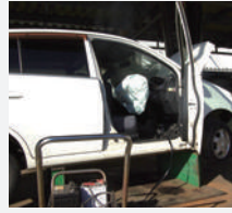
▲エアバックの回収作業。

▶自動車リサイクル法は、廃車の不法投棄の解消、産業廃棄物の最終処分場の逼迫、資源の有効利用を図る循環型社会の構築などが求められるが制定された。2005年から本格施行