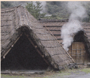
別府温泉・湯の花精製小屋

冷え症/荒れ性/神経痛/リウマチ/しもやけ/ひび/あかぎれ/うちみ/くじき 肩のこり/腰痛/痔/あせも/しっしん/疲労回復/産前産後の冷え症/にきび