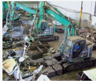
▶工場には電動マルチ解体機が横に3台並び、1台目はクルマの屋根をまくり上げ、内装や電気配線のハーネスを回収。2台目はそれを受けて床面のハーネス、細かな部品を類を外し、3台目がエンジンや足回りを取り外してボディだけになった車体をプレス機に入れてエコプレスに仕上げる。