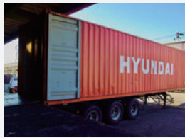
▲解体前の処理で取り外したエンジンやトランスミッションなどのリユース部品は、倉庫に一時保管したあと国内外へ出荷。道路が整備された国内のクルマは、廃車になっても足回りの良いものが多いとのことだ。