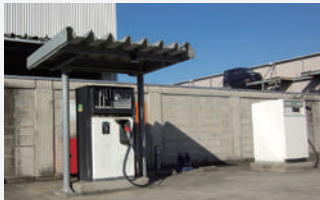
▶リサイクル機械を開発しなから自動車のリサイクルを進化させている日本オートリサイクル(株)は、「マルチ解体機」のほか、「廃油を精製する」「油水分離装置」や「タイヤホイール分離装置」など、数多くの特許を取得。写真は油水分離装置で精製したガソリンを使う給油所。