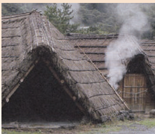
別府温泉・湯の花精製小屋

冷え症／荒れ性／神経痛／リウマチ／しもやけ／ひび／あかぎれ／うちみ／くじき肩のこり／腰痛／痔／あせも／しっしん／疲労回復／産前産後の冷え症／にきび