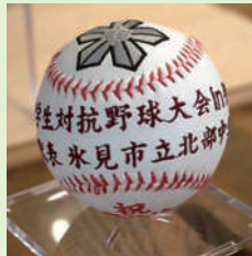
▲白球をを追った青春の思い出に「思い球〜オモイダマ〜」

縫い目の部分的な修繕が1筒100円、ほとんど直す場合は200円である。また、同事業所では、学校名、校章、選手名、監督の言葉を刺繍で入れた記念球「思い球〜オモイダマ〜」を1筒2500円で作っている。