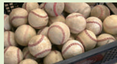
▲修繕されたボール。このように箱に入れて生徒たちに届けられる。

縫い目の部分的な修繕が1筒100円、ほとんど直す場合は200円である。また、同事業所では、学校名、校章、選手名、監督の言葉を刺繍で入れた記念球「思い球〜オモイダマ〜」を1筒2500円で作っている。