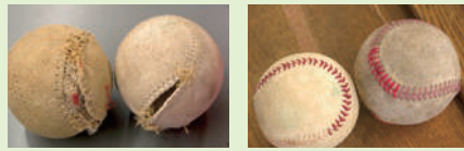
▲左は修繕前の縫い目の破れたボール。右が修繕後。

修繕を終えたボールを練習中のグラウンドへ届けに行くと、「生徒たちが受け取りに走り寄りて迎えに来てくれるなど、その喜ぶ顔を見ていると、値上げをしたい修繕費が言い出せなく」といっ。