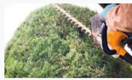
▲富山新港元気の森公園・パークゴルフ場