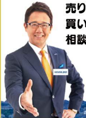
ハウズドゥイメージキャラクター 古田敦也氏