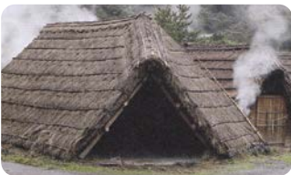
別府温泉・湯の花精製小屋